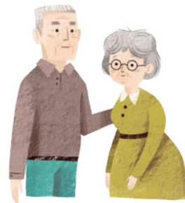
Nonno e nonna