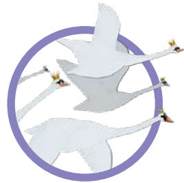
I CIGNI SELVATICI