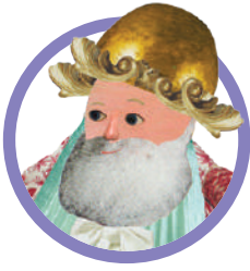
L'IMPERATORE (I vestiti nuovi dell'imperatore)