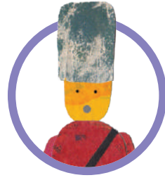
IL SOLDATINO DI STAGNO