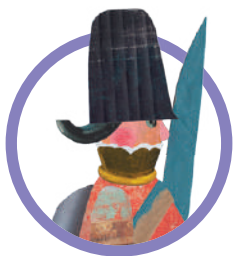
IL SOLDATO (L'acciarino)