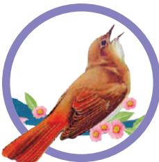
L'USIGNOLO (L'usignolo e l'imperatore)