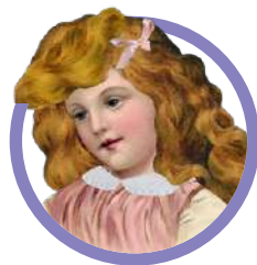
LA PRINCIPESSA SUL PISELLO