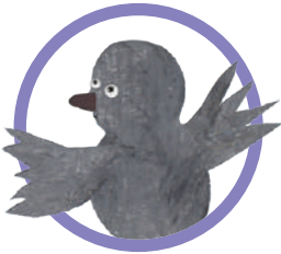
IL BRUTTO ANATROCCOLO