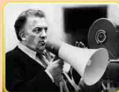
8. Federico Fellini è un ...