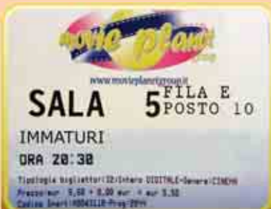
7. Il ...