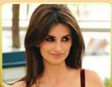
6. Penélope Cruz è un'...