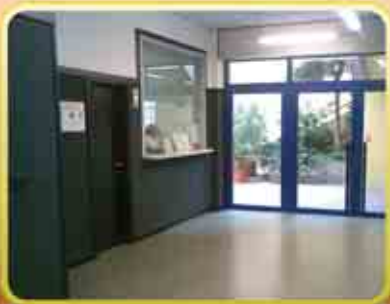
3. Il ...