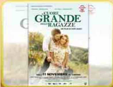
4. La ... del film