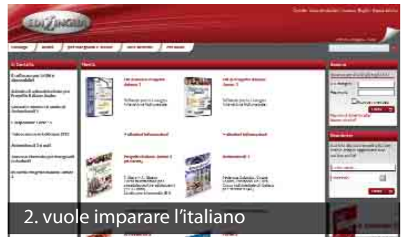
2. vuole imparare l'italiano