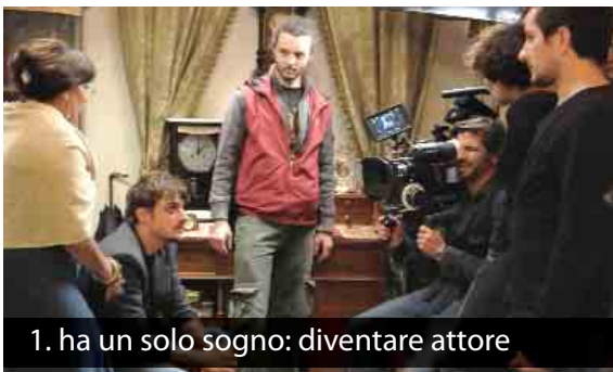
1. ha un solo sogno: diventare attore