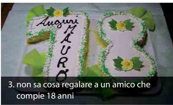
3. non sa cosa regalare a un amico che compie 18 anni