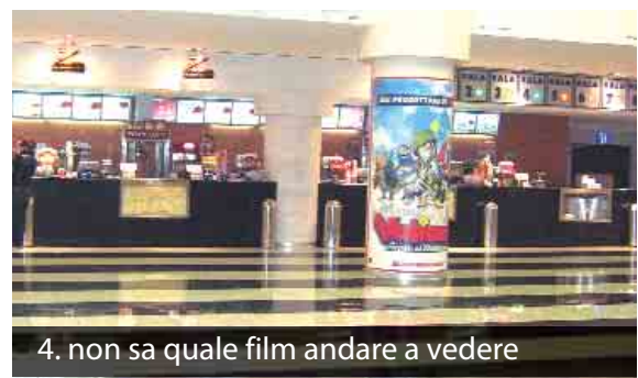
4. non sa quale film andare a vedere