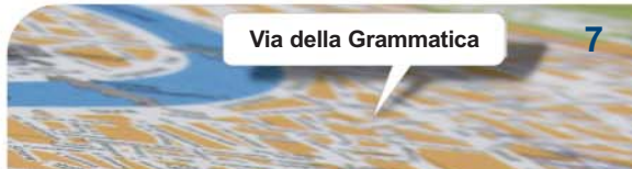
Via della Grammatica

penna canale tavolo libro porta finestra attore lezione mamma