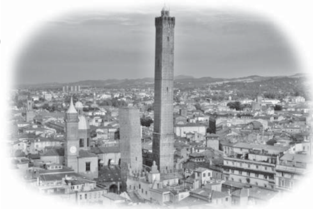
Le due Torri, Bologna