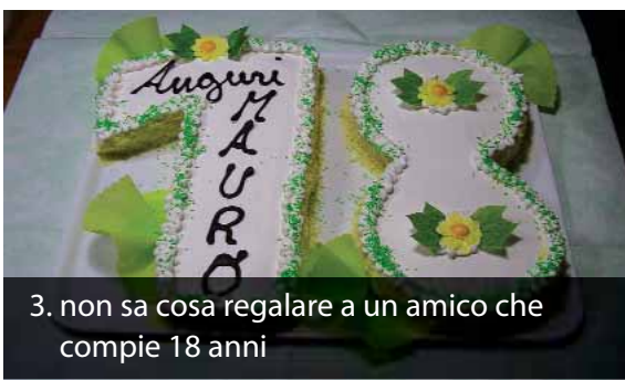
3. non sa cosa regalare a un amico che compie 18 anni