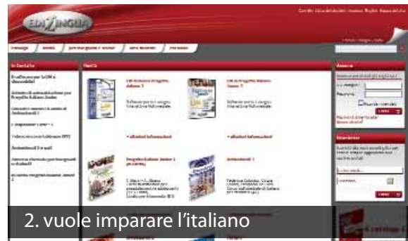
2. vuole imparare l'italiano