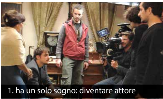
1. ha un solo sogno: diventare attore