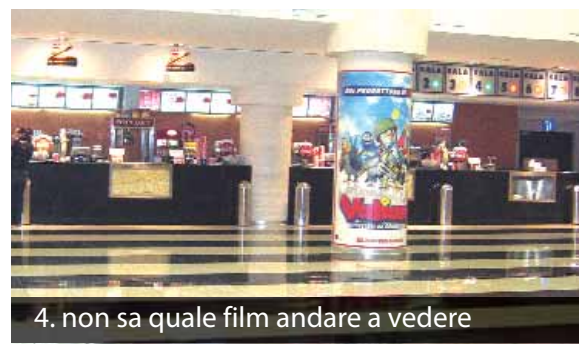
4. non sa quale film andare a vedere