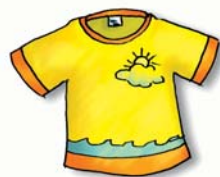
UNA MAGLIETTA GIALLA