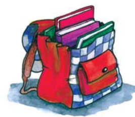
UNO ZAINO ROSSO