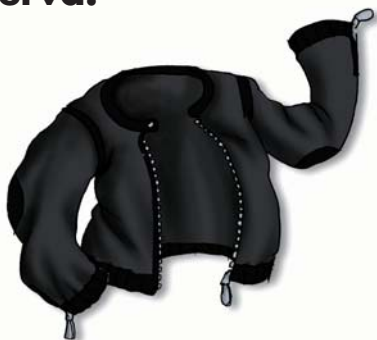
UN GIUBBOTTO NERO