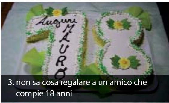
3. non sa cosa regalare a un amico che compie 18 anni