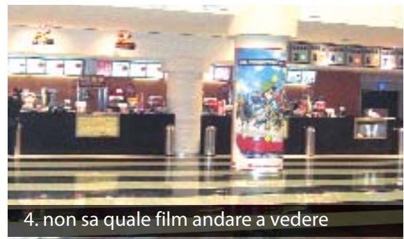
4. non sa quale film andare a vedere