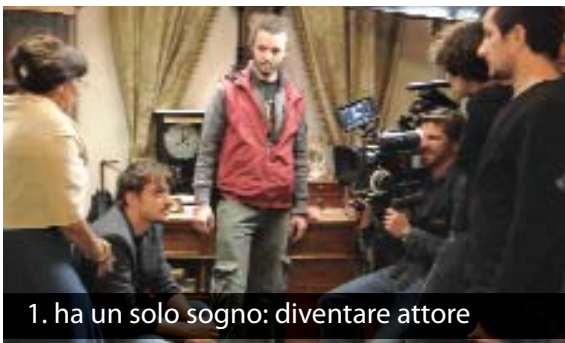
1. ha un solo sogno: diventare attore