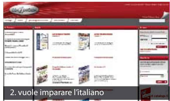
2. vuole imparare l'italiano