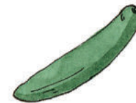
die Gurke il cetriolo